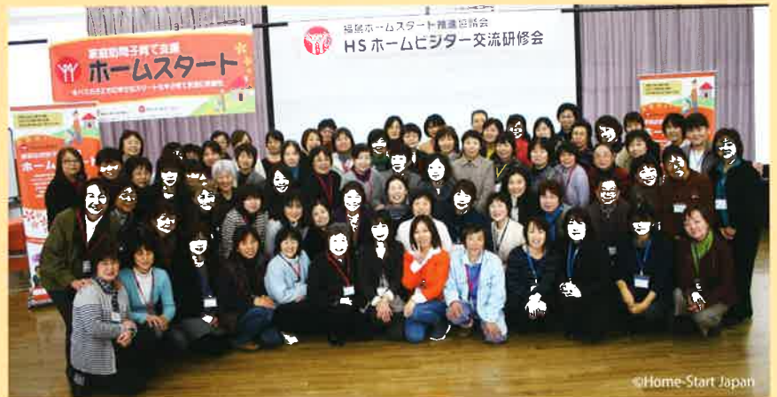
福島ホームスタート推進協議会主催 県内ホームビジター交流研修会