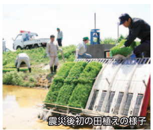
震災後初の田植えの様子

まとまった面積でコメを栽培するのは、東日本大震災後初めてとなります。収穫したコメは放射性物質の濃度を調べる分以外廃棄されますが、参加した皆さんは4年ぶりの田植え作業に生き生きと取り組んでいました。